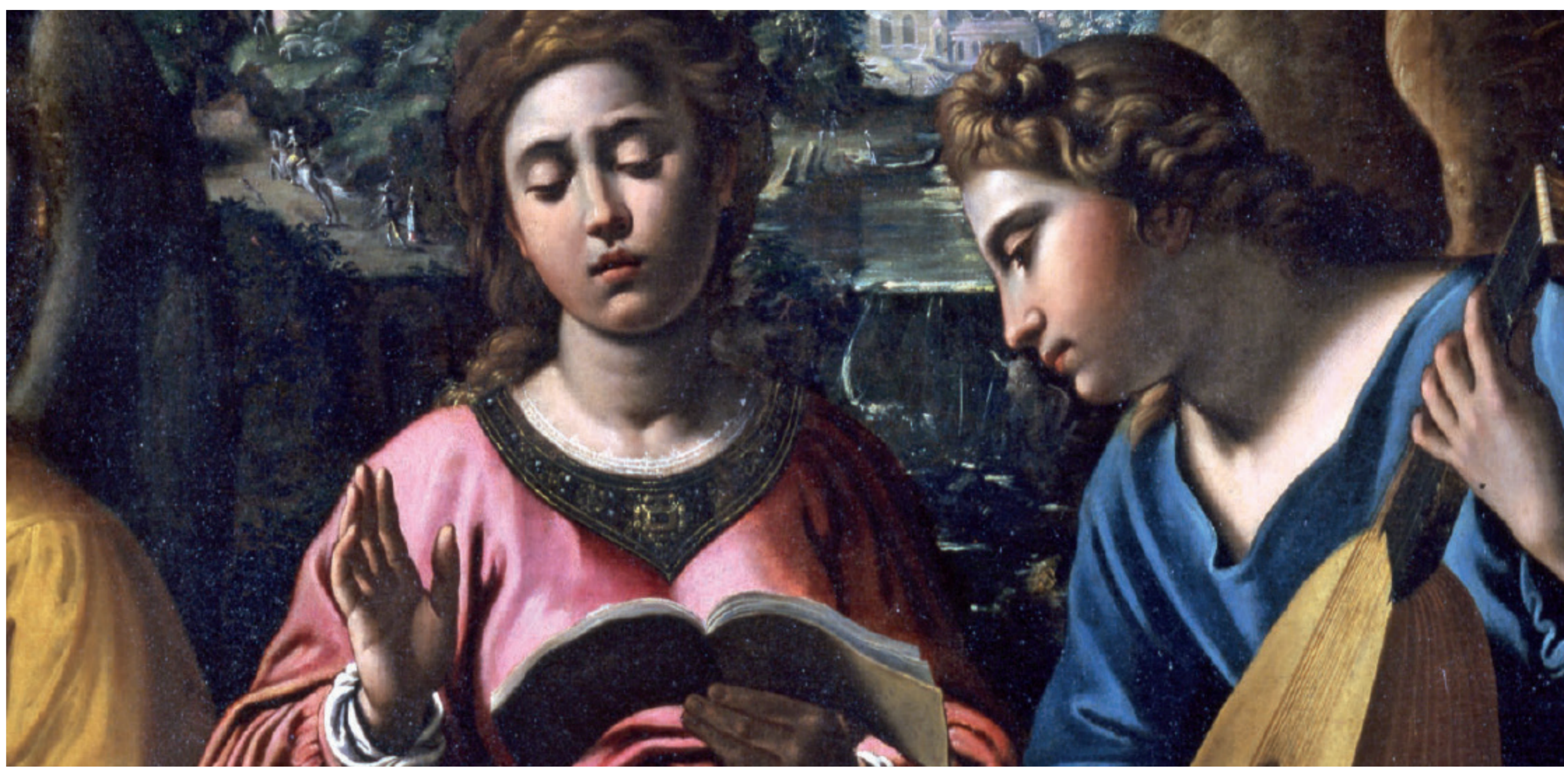
ANTIVEDUTO GRAMATICA Santa Cecilia e Angeli Musicanti (La Musica) (1619 c.a.) Musei Civici di Treviso Pinacoteca